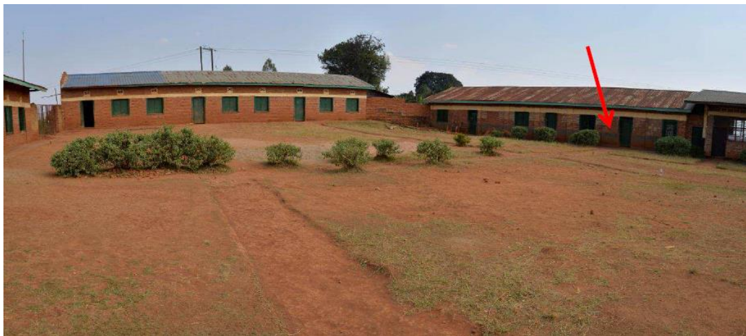
Bild 6.2, exponerad åt sydväst från skolgården, som visar de två skolbyggnader som fanns vid tidpunkten för folkmordet. Pilen visar den byggnad som benämndes ”ateljén”.

Byggnaderna är uppförda med tegelväggar och har plåttak. Vid tidpunkten för folkmordet fanns endast två skolbyggnader på platsen, de byggnaderna ingår nu i den södra och sydvästra delen av den nuvarande skolan. Byggnaderna är enkla till sin konstruktion samt saknar isolering och innertak. Den sydvästra byggnaden benämndes 1994 som ”ateljén”.