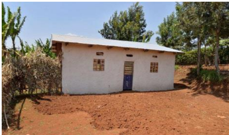
Bild 5.2 Bilden visar platsen där blendehuset fanns 1994. Huset på bilden är uppfört senare men står på den plats där blendehuset låg.