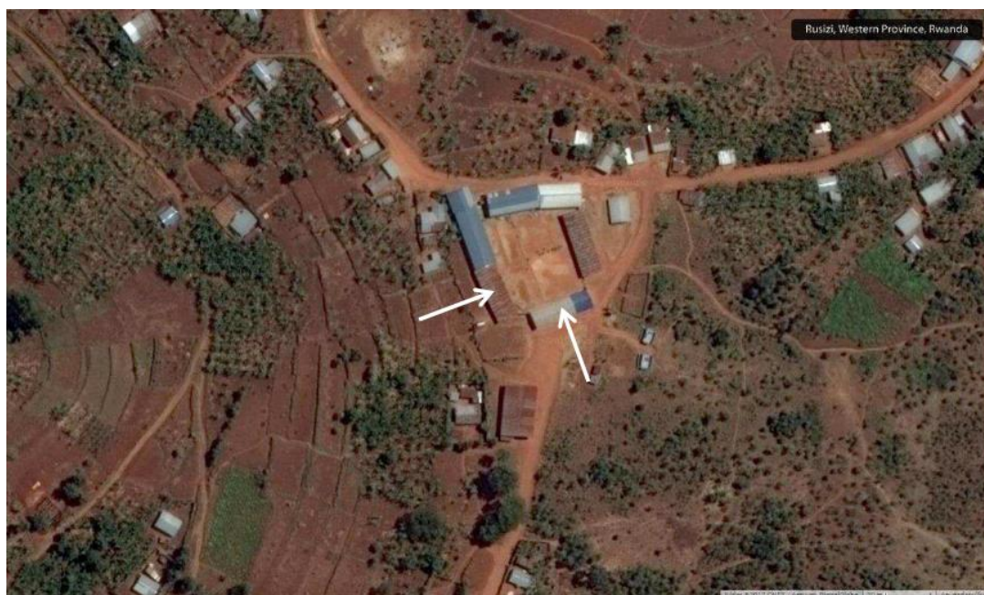
Bild 6.1 Satellitbild som i mitten visar skolan i Nyakanyinya. Pilarna markerar de två byggnader som fanns 1994.

Skolan består av fem byggnader som är uppförda utefter en rektangulär innergård som fungerar som skolgård. Skolgårdens yta är uppmätt till 1 200 m 2 .