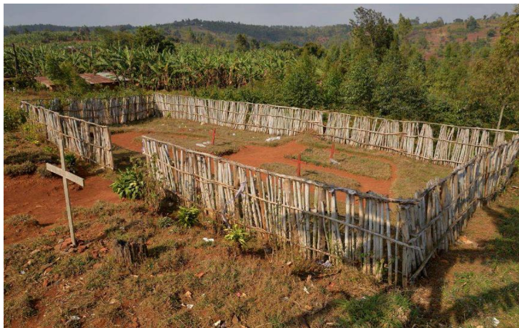
Bild 6.3 Bilden visar massgrav utanför skolan i Nyakanyinya.