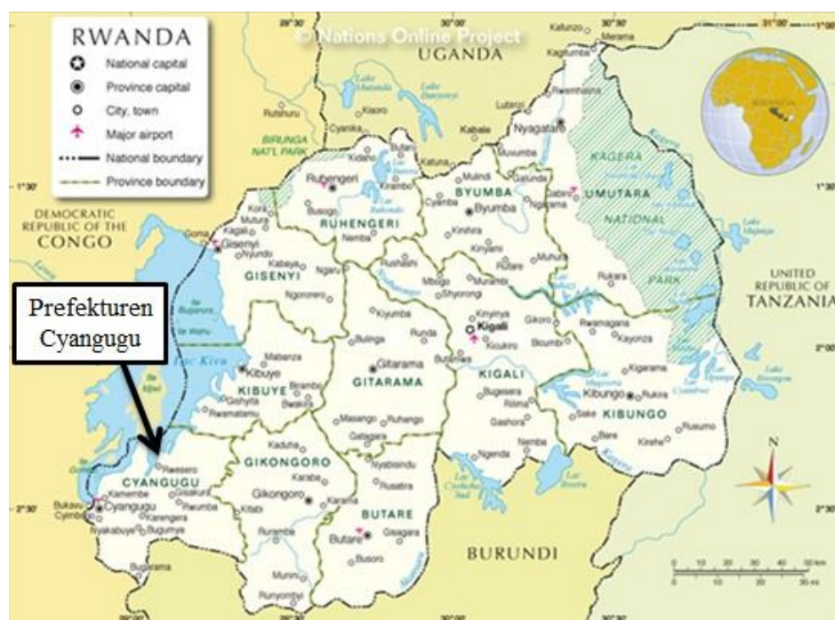
Bild 1.1 Kartbild som visar den administrativa indelningen av Rwanda år 1994 med prefekturen Cyangugu särskilt utmärkt.

Rwanda är ett litet land i centrala Afrika. Under 100 dagar mellan den 6 april och den 18 juli 1994 pågick ett folk mord i landet. Under folk mordet dödades omkring 800 000 personer. Idag är Rwanda administrativt indelat i fem olika provinser, västra, södra, östra och norra provinsen samt Kigali. År 1994 var landet indelat på annat sätt. Landet bestod då av elva prefekturer. Brottsplatserna i målet finns i den dåvarande prefekturen Cyangugu i den sydvästra delen av landet. Prefekturen var i sin tur indelad i kommuner som i sin tur var indelade i sektorer, som också var indelade i celler, motsvarande byar.