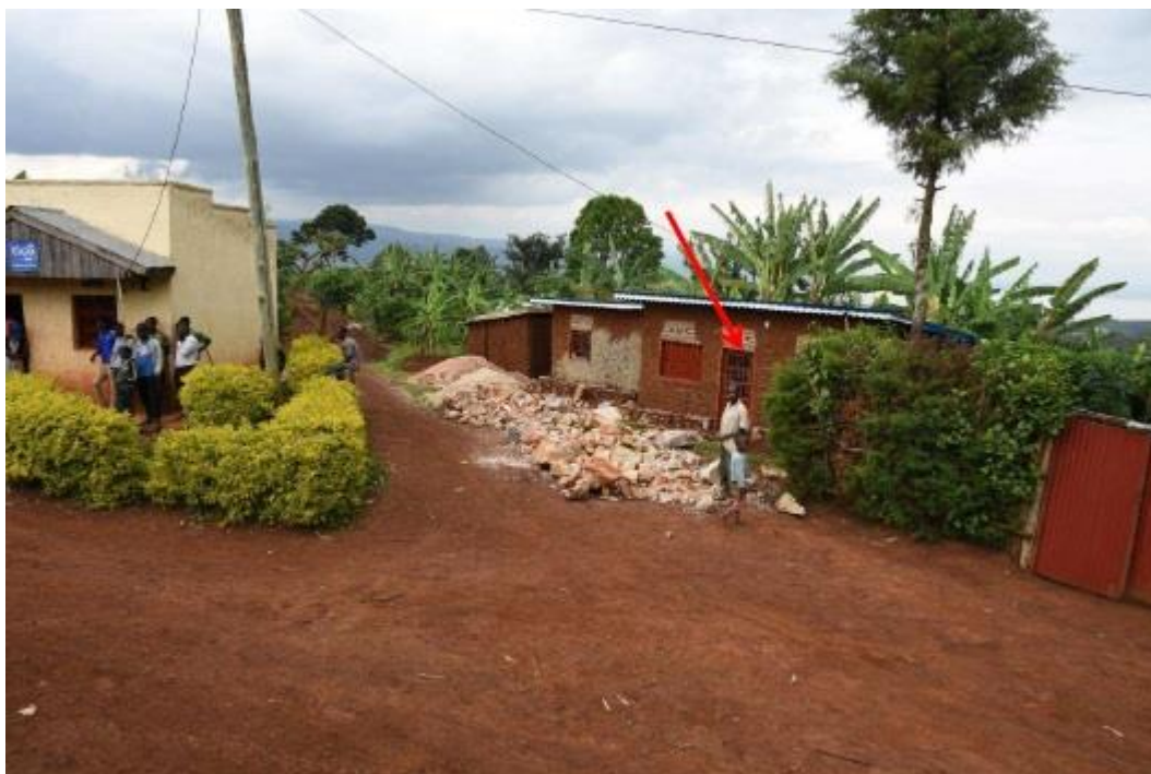
Bild 5.1. Den aktuella butiken finns inte längre kvar men pilen visar platsen där butiken/baren fanns vid tidpunkten för folkmordet 1994.