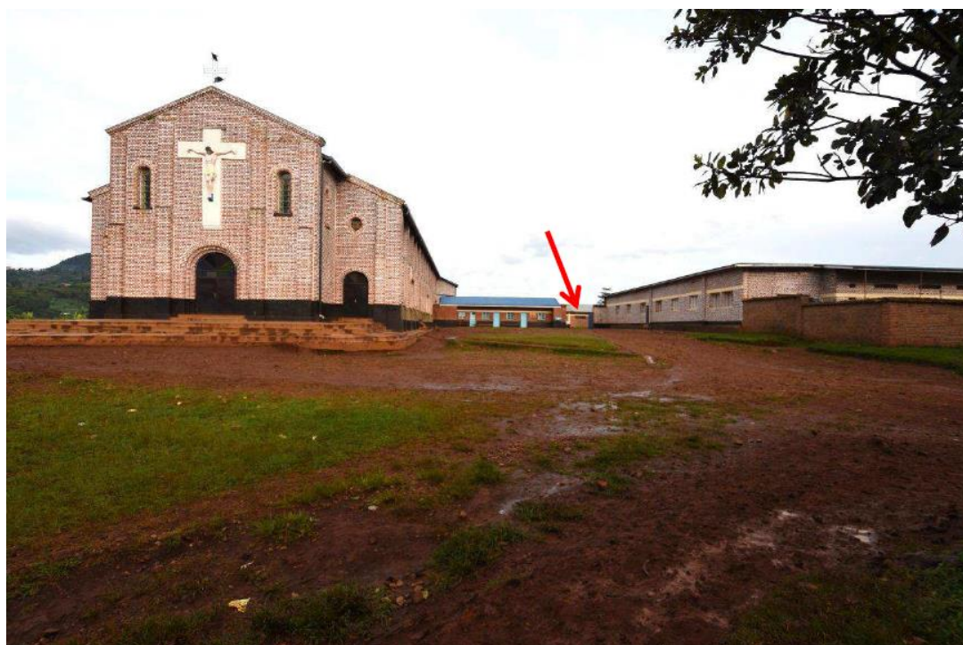
Bild 7.1 Bilden visar kyrkan i Mibilizi och prästbostaden till höger i bild. Pilen markerar en port mellan byggnaderna.

nunnor och annan personal samt ett sjukhus. Många människor tog sin tillflykt till församlingen i Mibilizi under folkmordet.